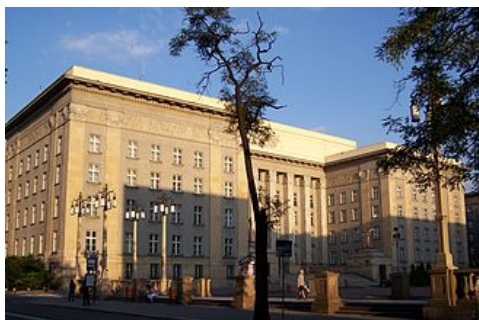
Sejm Śląski (1920 -1945)

Zabytkowy budynek znajdujący się w centrum Katowic, przy ulicy Jagiellońskiej 25. Wybudowany w stylu modernistycznym. W okresie międzywojennym jeden z największych budynków administracyjnych w Polsce. Jego sala sejmowa była wzorcem dla sali Sejmu II RP.