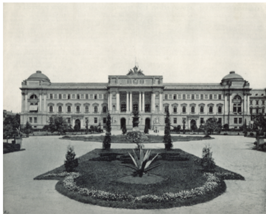
Sejm Krajowy we Lwowie (1861-1920)

Dowodem na niszczenie przez masońską II RP polskiej samorządności sejmikowej i sejmowej jest wydanie w dniu 30 stycznia 1920 roku Ustawy 61 „O zniesieniu Sejmu i Wydziału Krajowego b. Królestwa Galicji i Lodomerii z Wielkim Księstwem Krakowskim”. Zgodnie z art. 1 tejsze ustawy „Znosi się ustanowiony statutem krajowym z 26 lutego 1861 roku Sejm (...)”