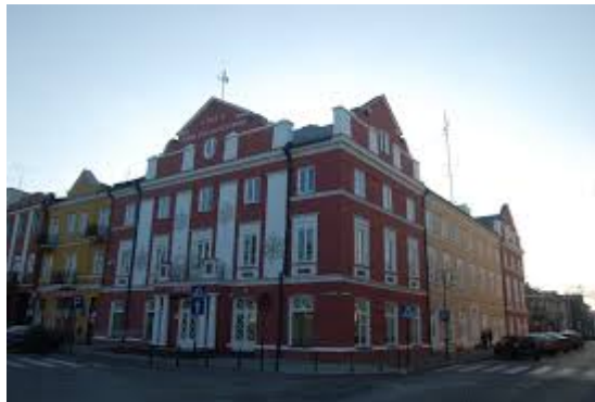
Dom Sejmikowy w Krasnymstawie

Wyjątkiem od reguły był Śląsk, który nie wszedł z automatu w skład II RP ale dopiero walczył o przyłączenie do Polski poprzez III Powstania