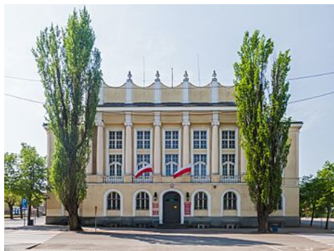
Dom Sejmikowy w Skierniewicach

Nie zagospodarowano sejmikowo spontanicznie budowanych tzw. Domów Sejmikowych np. w Skierniewicach (1921) i Krasnymstawie. Wolni Polacy nie wyobrażali sobie życia bez Sejmów Regionalnych (Generalnych) i Sejmików Ziemskich. Niestety masoni w II RP skutecznie zablokowali ten proces budzenia się oddolnej inicjatywy samorządowej opartej na Sejmikach Ziemskich i Sejmach Regionalnych.