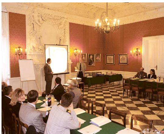
Sala „4 Pory Roku”