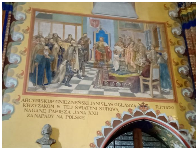
ARCYBISKUP GNEZNEŃSKI JANISŁAW OGŁASZA KRZYŻAKOM W TEJ ŚWIĄTYNI SUROWĄ NAGANĘ PAPIEŻA JANA XXII ZA NAPADY NA POLSKĘ RP1320

Łokietkowi, po 241 latach, czyli od detronizacji Bolesława II Szczodrego, po zabójstwie Biskupa Stanisława w roku 1079, udało się Zjednoczyć Ziemie Polskie, jako Królestwo Polskie z koronowanym Królem. Bowiem w roku 1320, w dniu 20 stycznia, został koronowany na Wawelu, na Króla Polski, a jego żona Jadwiga na Królową Polski. Koronacji dokonał Arcybiskup Gnieźnieński Janisław, ten sam, który w tym samym 1320 roku ogłosił w pobliskim kościele św. Stanisława w Brześciu Kujawskim surową nagane Papieża Jana XXII Krzyżakom, za napady na Polskę. Odpowiedni fresk upamiętniający to wydarzenie, znajduje się w nawie bocznej kościoła św. Stanisława w Brześciu Kujawskim.